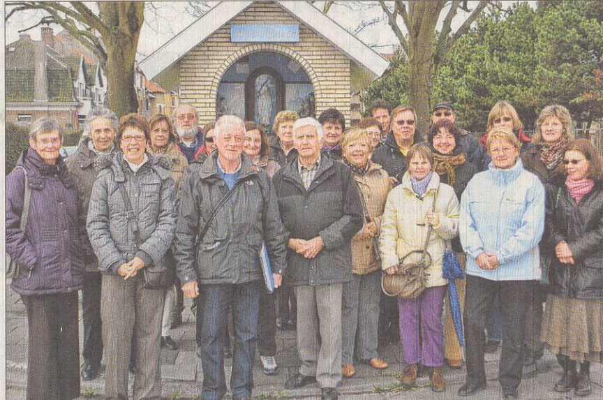
De erfgoedwandeling startte aan het kapelletje op het Bauwensplein, dat toegewijd is aan Onze-Lieve-Vrouw.