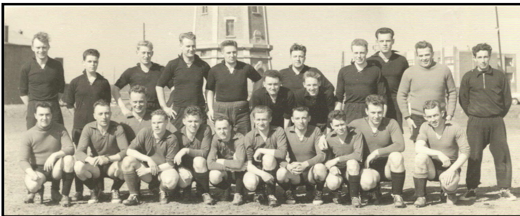
Voetbalmatch 25 april 1958 Officieren– Onderofficieren: 2-1 Wie herkent op de bovenste rij, 2 leden van Lange Nelle?

Zij voeren gepland groot en klein onderhoud en herstellingen uit, bouwen nieuwe constructies enz.